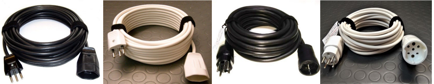
T12/10A/230V/3x1-1.5mm 2 Typ 111-1sz = 3x1mm 2 Typ 111-2sz = 3x1,5mm 2 T12/10A/230V/3x1-1.5mm 2 Typ 111-1w = 3x1mm 2 Typ 111-2w = 3x1,5mm 2 T15/10A/400V/5x1.5mm 2 Typ 333sz T15/10A/400V/5x1.5mm 2 Typ 333w

Auch mit Twint auf 079 462 49 37 zahlbar, dabei Lieferadresse und Kabeltyp angeben