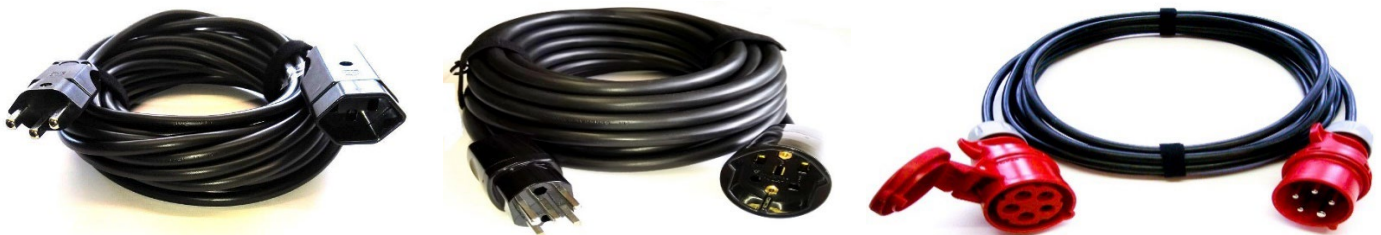
T23/16A/230V 3x2,5mm 2 Typ 222sz T25/16A/400V 5x2,5mm 2 Typ 444sz CEE16-5/400V 5x1,5mm 2 oder 5x2,5mm 2 Typ 666-1 = 5x1,5mm 2 – 8kW Typ 666-2 = 5x2,5mm 2 – 11kW